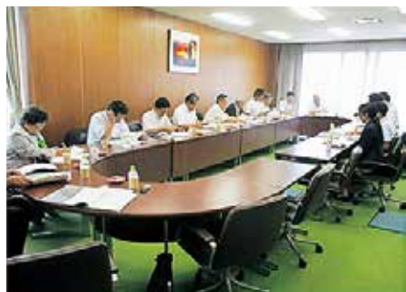
明石市での視察の様子（7/22）

現在、明石市の人口は、平成25年から連続増加中で、本年7月1日現在、30万3,597人と、目標の30万人を超えて順調に増えているとのことでした。