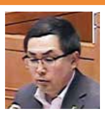
永井 隆文 (公明党)