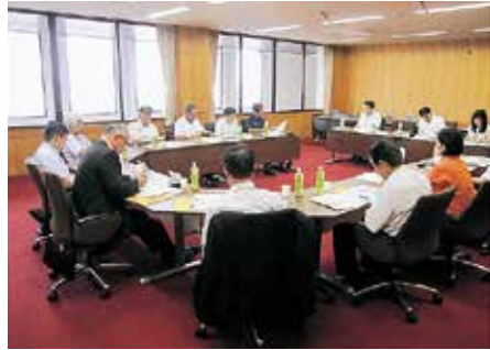
北名古屋市での視察の様子（7/23）

北名古屋市議会では、市民から議会活動や委員会活動などについての意見、要望等を聴取し、市民ニーズを反映した議会運営を図るため、市議会モニター制度を導入しています。満18歳以上で市内に在住、在勤又は在学している方で市議会に関心のある方や団体からの推薦を受けた方を10名程度募集して、市議会の会議を傍聴し、議会運営の見聞を広げるとともに、意見や提案等を文書により提出したり、議会が行うアンケート調査等に回答していただきます。また、市議会だよりについては、文字数を少なくし、写真・イラストを増やすなどを改善のコンセプトとし、中でも特長的是であるのは、地元名古屋芸術大学と連携して、風景などのイラストを表紙に採用しており、目を引く演出をすることで、広報紙を手にとりていただきやすいように工夫されていました。