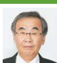
谷口 芳史 (公明党)